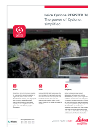
Leica Cyclone REGISTER 360

Leica Geosystems AG Heinrich-Wild-Strasse 9435, Heerbrugg, Suisse +41 71 727 31 31