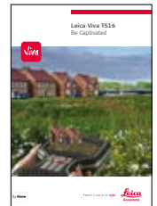
Leica Viva TS16