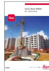
Leica Nova MS60