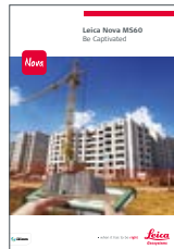
Leica Nova MS60

Illustraties, beschrijvingen en technische gegevens zijn niet bindend. Alle rechten voorbehouden. Gedrukt in Zwitserland – Copyright Leica Geosystems AG, Heerbrugg, Zwitserland, 2015. 836344nl – 05.15 – INT