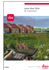
Leica Viva TS16