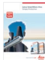
Leica SmartWorx Viva Brochure Produit