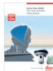
Leica Viva GNSS Brochure Produit