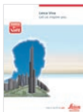
Leica Viva Brochure générale

Illustrations, descriptions et données techniques non contractuelles. Tous droits réservés. Imprimé en Suisse – Copyright Leica Geosystems AG, Heerbrugg, Suisse, 2009. 774269fr – VI.09 – RDV