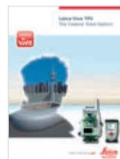
Leica Viva TPS Brochure Produit