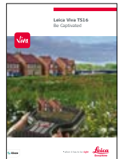
Leica Viva TS16