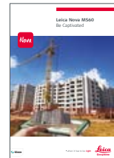
Leica Nova MS60