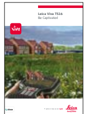
Leica Viva TS16