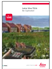
Leica Viva TS16