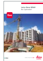
Leica Nova MS60