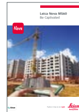
Leica Nova MS60