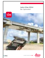
Leica Viva GS14