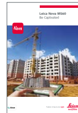
Leica Nova MS60