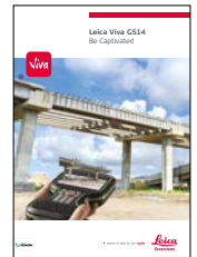
Leica Viva GS14