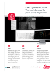
Leica Cyclone REGISTER