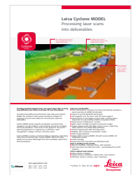
Leica Cyclone MODEL