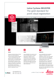
Leica Cyclone REGISTER