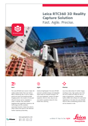
Leica RTC360 La solución para la captura de realidad 3D

Heinrich-Wild-Strasse 9435 Heerbrugg, Suiza +41 71 727 31 31