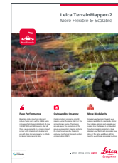
Leica TerrainMapper-2 最高精度かつ効率的な次 世代型航空レーザー