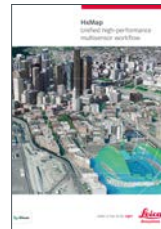
Leica HxMap 高パフォーマンスマルチ センサー・ワークフ ロー