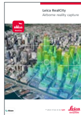
Leica RealCity エアボーンリアリティ キャプチャー

イラスト、説明、技術データは変更されることがあります。無断複写・複製・転載を禁じます。 Copyright Leica Geosystems AG, Heerbrugg, Switzerland, 2021. 907362ja - 03.21