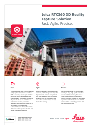
Leica RTC360 Skaner laserowy 3D

Aktywne Wsparcie Klienta to program partnerski prowadzony dla Klientów przez Leica Geosystems. Pakiety Opieki Technicznej (CCP) zapewniają optymalne wsparcie techniczne i bieżące aktualizacje oprogramowania celem utrzymania wydajności pracy Twojego instrumentu na najwyższym poziomie. Na portalu myWorld @ Leica Geosystems znajdziesz obszerną informację przez 24/7.