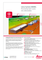
Leica Cyclone MODEL