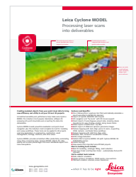
Leica Cyclone MODEL

Leica Geosystems AG Heinrich-Wild-Strasse 9435, Heerbrugg, Suisse +41 71 727 31 31