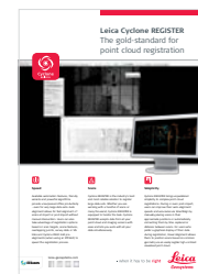
Leica Cyclone REGISTER