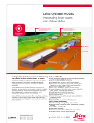
Leica Cyclone MODEL