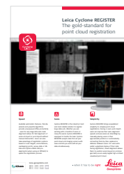
Leica Cyclone REGISTER