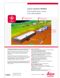
Leica Cyclone MODEL

Leica Geosystems AG Heinrich-Wild-Straße 9435 Heerbrugg, Schweiz +41 71 727 31 31