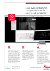
Leica Cyclone REGISTER