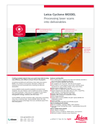
Leica Cyclone MODEL