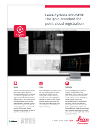
Leica Cyclone REGISTER