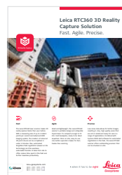
Leica RTC360 3D-Reality-Capture- Lösung

Heinrich-Wild-Straße 9435 Heerbrugg, Schweiz +41 71 727 31 31