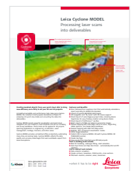
Leica Cyclone MODEL