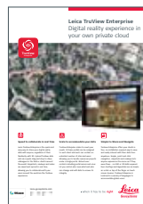
Leica TruView Enterprise

Copyright Leica Geosystems Sp. z o.o., Warszawa, Polska. Wszystkie prawa zastrzeżone. Wydrukowano w Polsce – 2019. Leica Geosystems Sp. z o.o. należy do grupy Hexagon AB. 870819pl - 08.18