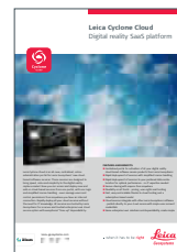
Leica Cyclone Cloud