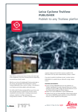
Leica Cyclone TruView Publisher