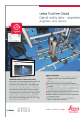
Leica TruView Cloud

Copyright Leica Geosystems AG, 9435 Heerbrugg, Schweiz. Alle Rechte vorbehalten. Gedruckt in der Schweiz – 2017. Leica Geosystems ist Teil von Hexagon. 865506de – 11.17