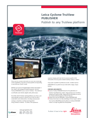
Leica Cyclone TruView Publisher

Leica Geosystems AG Heinrich-Wild-Strasse 9435 Heerbrugg, Schweiz +41 71 727 31 31