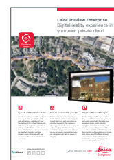
Leica TruView Enterprise