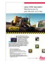
Leica iCON telematics Брошюра

Машинный приемник Leica iCON gps 80 GNSS — превосходный помощник во всех решениях управления машинами. Используя высокую точность прибора (до сантиметра), гибкость и современные технологические решения, вы можете гарантировать повышение производительности машины и эффективности работ, выполняемых на площадке.