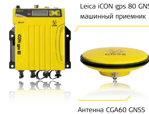
Leica iCON gps 80 GNSS машинный приемник

Машинный приемник Leica iCON gps 80 GNSS — превосходный помощник во всех решениях управления машинами. Используя высокую точность прибора (до сантиметра), гибкость и современные технологические решения, вы можете гарантировать повышение производительности машины и эффективности работ, выполняемых на площадке.